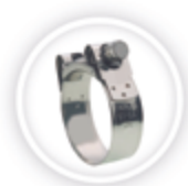
SUPRAKLEM W4 P195