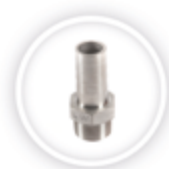
RVS SLANGPILAAR P190