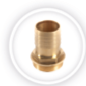
MESSING VAAREIND P186